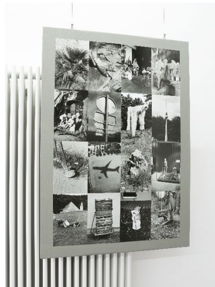
8 Martin Bertelmann: „Studienblatt nach August Kotsch“, 2025 © Martin Bertelmann