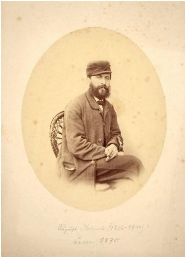
1 August Kotzsch: Selbstportrait, um 1870 Werkverzeichnisnummer K 75

Download in hoher Auflösung unter www.slubdd.de/kotzsch