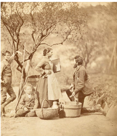
3 August Kotzsch: „Genrebild mit Kindern[n]“, um 1880 Werkverzeichnisnummer G 2 Deutsche Fotothek