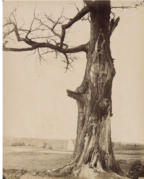
6 August Kotsch: „Großer Eichstamm“, 1860–1868 Werkverzeichnisnummer N 37