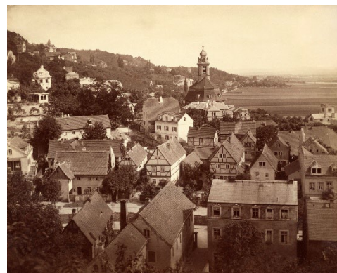
4 August Kotzsch: Blick vom Burgberg auf Loschwitz, um 1880 Werkverzeichnisnummer L 12 Deutsche Fotothek