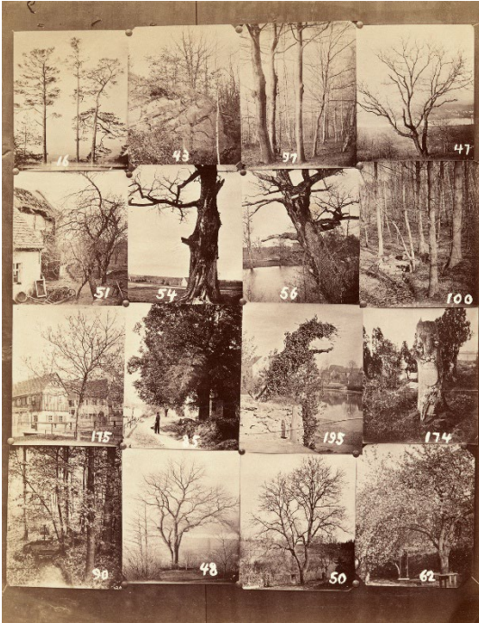
5 August Kotsch: Angebotsbogen 9, um 1880